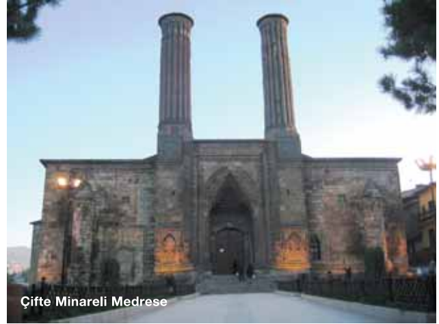
Çifte Minareli Medrese

Şehirde işinizi bitirdikten sonra, Türkiye'nin en iyi kayak pistlerinden olan Palandöken'e doğru keyifle yola alabilirsiniz. Eşsiz doğası, kayak pistleri ve güzel otelleri ile Palandöken'de keyifli dakikalar geçirirken kayak sporunu deneme fırsatı bulabilirsiniz. Harika manzaranın tadını çıkarırken, fotoğraf çekmenin de keyfine varabilirsiniz. Gezinizin sonunda Erzurum'dan ayrılırken ağzınızdan çıkacak kelimeler "iyi ki..."den başkası olmayacak.