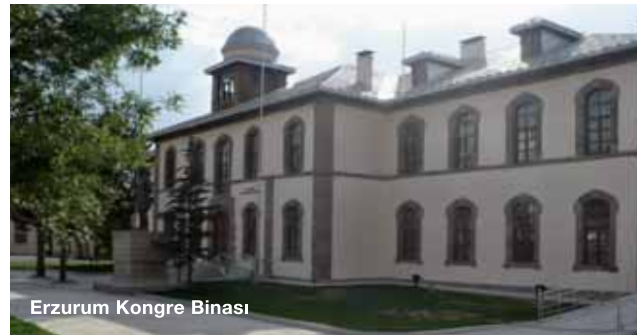
Erzurum Kongre Binası