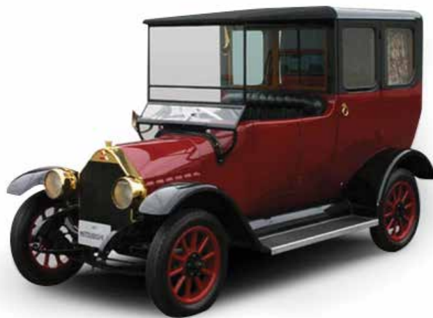
Mitsubishi Motors Model A, Ağustos 1917

MMC ikinci Dakar zaferini yedi yıl sonra, Thierry Sabine Kuruluşu (TSO) tarafından düzenlenen tüm Dakarların en uzun ve en zorlularından birinde kazandı. 1992'deki etkinlik Paris'te başladı ve 11 Afrika ülkesini geçtikten ve Kara Kıta'yı boyuna aştıktan sonra Cape Town'da bitti.