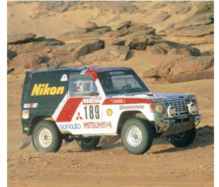
Mitsubishi Pajero, İlk Dakar Şampiyonluğu, Ocak 1985

2008'den bu yana geçen zaman içinde, yapılan olağanüstü çalışmalar ve çalışılan yetenekli sürücülere rağmen, Dakar Rallis'i'nin ve motor sporlarının tarihinde hiçbir üretici Mitsubishi Motors'un Pajero ile kazandığı efsanevi başarıların yanına bile yaklaşamadı.